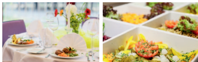
Gestaltung: P. Nyenhuis/BRANDT Media

Sie wünschen eine individuell auf Ihre Veranstaltung zugeschnittene Speisenauswahl? Gerne erstellen wir Ihnen auf Anfrage ein individuelles Menü, exklusive Fingerfoodvorschläge oder zusätzliche Snacks zur Kaffeepause. Sprechen Sie uns einfach an.