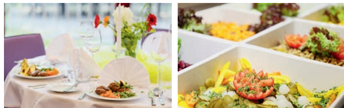
Fotos: (ausßen) roland goseberg photographie; (innen) Christian Ahrens, roland goseberg photographie; Gestaltung: P. Nyenhuis/BRANDT Media

Sie wünschen eine individuell auf Ihre Veranstaltung zugeschnittene Speisenauswahl? Gerne erstellen wir Ihnen auf Anfrage ein individuelles Menü, exklusive Fingerfoodvorschläge oder zusätzliche Snacks zur Kaffeepause. Sprechen Sie uns einfach an.